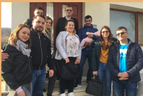
La încheierea catehezei logodnicilor