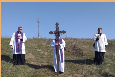
Calea Crucii de Florii spre Garaga