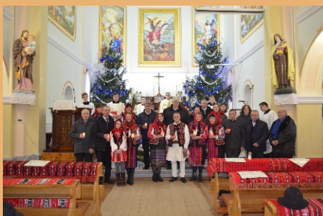
Felicități familiilor jubiliare!