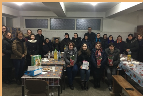
Întrunirea lunară A.C.