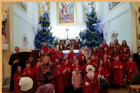
Amintiri de la concertul de Crăciun