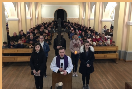
Calea Sfintei Cruci la începutul Postului