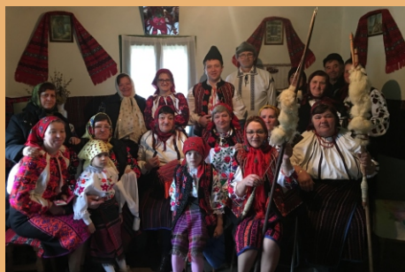
Șezătoare înainte de Postul Mare