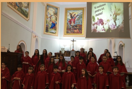
La concertul de Ziua Mamei