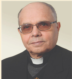
Pr. CIRIL BLAJ

9 octombrie 1939 † 21 octombrie 2024 Oituz Valea Mare