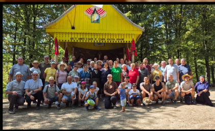
Pelerinaj la Ciciola