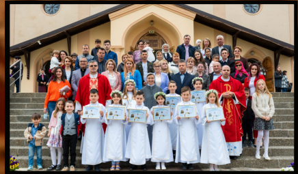
Prima Sfântă Împărtășanie