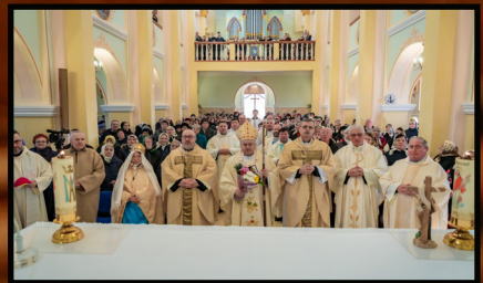
Întâlnirea terțiarilor din Moldova